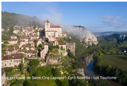
Vue aérienne de Saint-Cirq-Lapopie

Retour à Cahors en car. Dîner et nuit à l'hôtel.