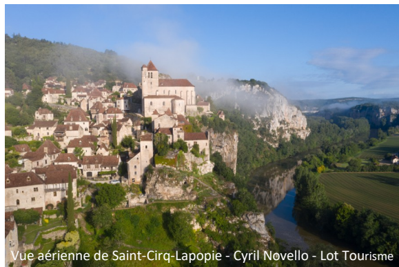
Vue aérienne de Saint-Cirq-Lapopie